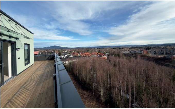
God utsikt fra toppetasjen.