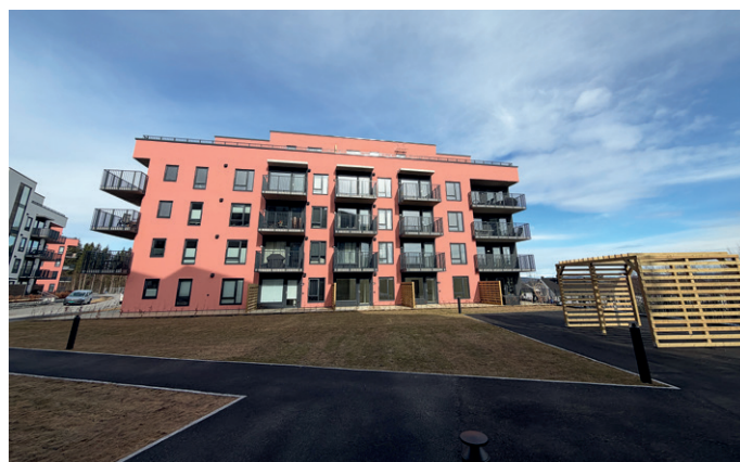
Råholtåsen felt 4 består av 68 leiligheter fordelt på to like blokker.

– Vi startet samarbeidet med STØ tilbake i 2017, og dette har vært basert på samspill med åpen bok. Vi er blitt enige om en antatt