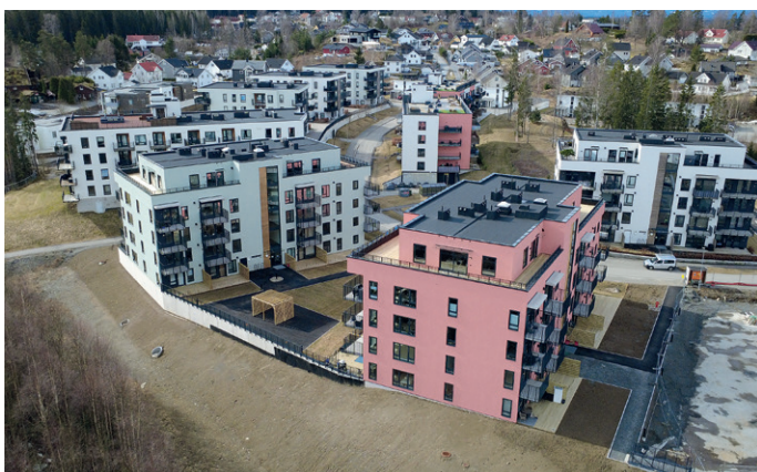
Den første blokka i felt 4, Firkløveret, ble overlevert i november/ desember i fjor, og den siste, Lyngen (som ligger nærmest i bildet), ble overlevert i februar. Innflyttingen pågår nå for fullt.

– Det er mange godt voksne som hatt en enebolig i nærområdet, som vil flytte inn i en lettstelt leilighet. Samtidig har vi hatt flere førstegangskjøpere som gjerne har hatt tilknytning til området fra tidligere og som ønsker å kjøpe sin første bolig her. I de senere trinnene har dette endret seg litt, med mange nye førstegangskjøpere som ikke har tilknytning til området. Trekkplasteret er kort vei med tog til Oslo og kort avstand til Gardermoen og hele verden. Det er også slik at mange opplever å få mye for pengene her, og