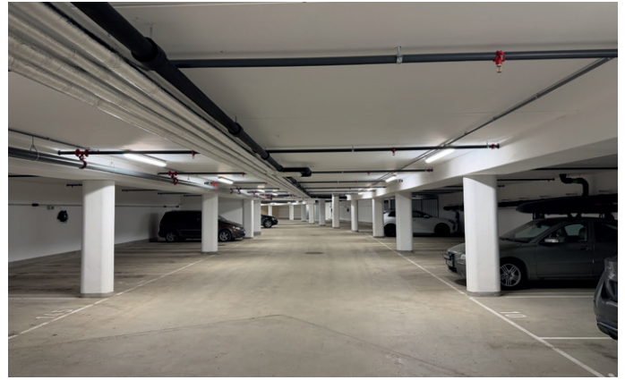
Det er en stor felles parkeringskjeller under hele området, som totalt rommer 156 parkeringsplasser samt boder, sykkelparkering og tekniske rom.

den videre utbyggingen. Dette har vært et stort og godt prosjekt for oss, og vi har hatt et veldig godt samarbeidsklima med byggherre og øvrige samarbeidspartnere, sier hun.