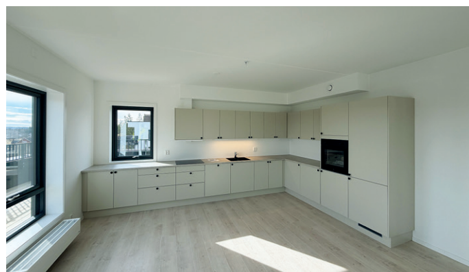
Fra en av kjøkkenløsningene.