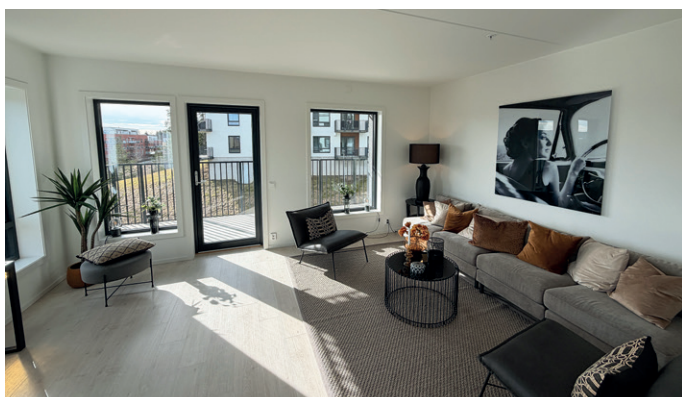
Leilighetene varierer i størrelse fra 36 kvadratmeter til 145 kvadratmeter.