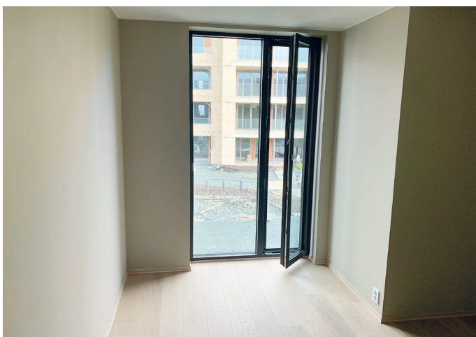
Soverom med fransk balkong.