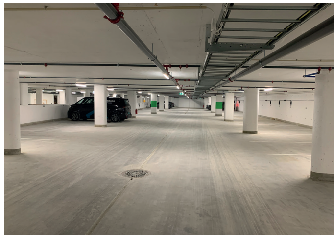
Parkeringskjelleren, som ligger under flomålet, har totalt 157 p-plasser.

ligområde med helt spesielle kvaliteter, som tar opp i seg den unike beliggenheten - bokstavelig talt på vannet.