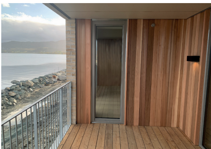
Utsikt over Strindfjorden.