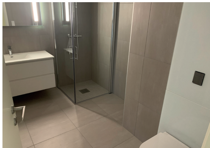
Badet i en av fjordleilighetene.

skillevegger i betong/isolert bindingsverk og yttervegger i isolert bindingsverk. Utvendig kles bygget med lyst tegl i forskjellige sandfargede nyanser og med stående sederpanel i balkongsonen.