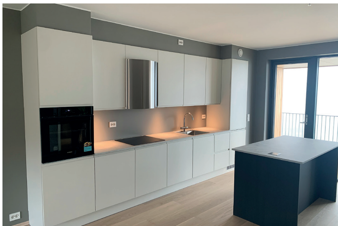
Kjøkken fra XL-Bygg/JKE i både rekkehusene og leilighetsbyggene.

Første byggetrinn på Grilstad Marina, Vannspeilet med 141 bo-