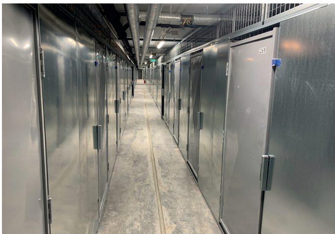
102 boder på fem eller ti kvadratmeter.