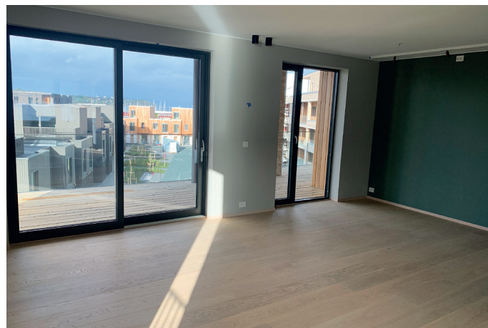
Leiligheter og rekkehus har stort sett gjennomgående oppholdsrom for best mulige utsiktsforhold.