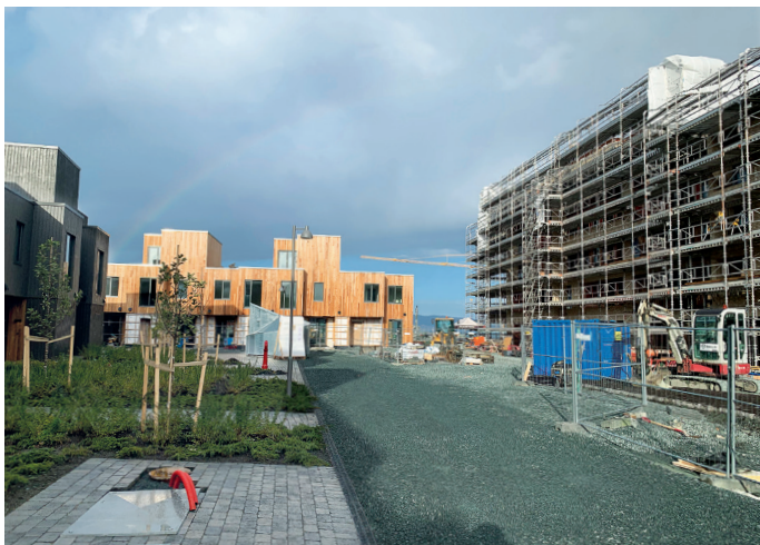
Fullriggerøya utgjør siste del av Grilstad Marina og skal i alt gi plass til 380 boliger.