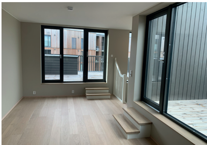
Fra loftstuen i rekkehus på tre plan med utgang til terrasser.