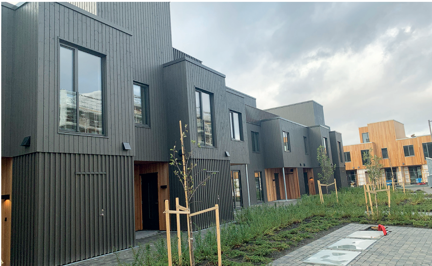
Uterommet er det grønne «øye» med forskjellige karakterer og alt fra matnyttig vegetasjon til prydevekster i varierende høyder.