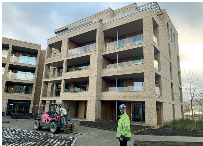
Prosjektleder Frode Odden er fornøyd med resultatet. Materialer som lyst tegl og ubehandlet seder er gjennomgående tema.