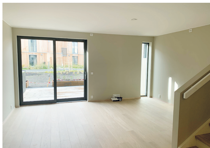
Stuen i rekkehusene har terrasse også på bakkeplan.

Salg, utleie og montering av høykvalitets stillas- systemer i aluminium