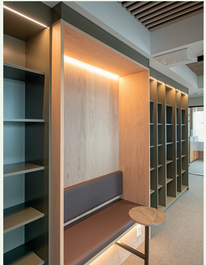
Innredningen hos Wikborg har mye heltre.

Da byggeaktiviteten var på topp var 90 personer med.