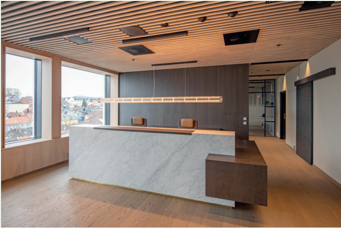
Resepsjon hos Wikborg Rein.