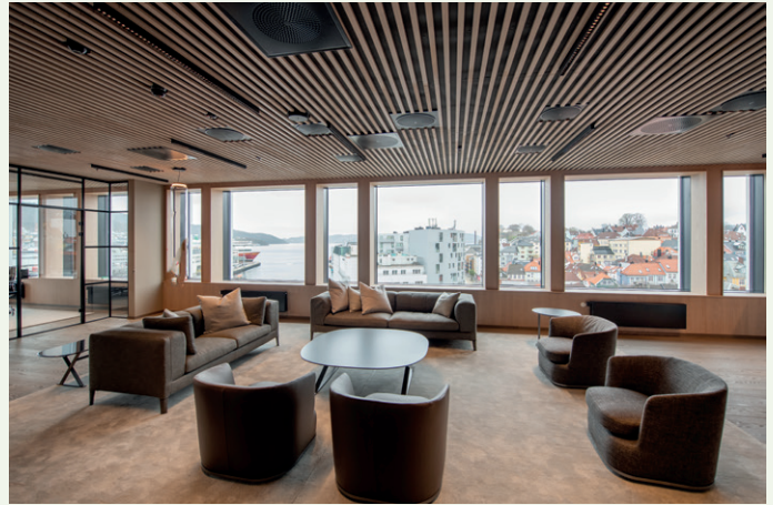
Sosial sone hos Wikborg Rein.