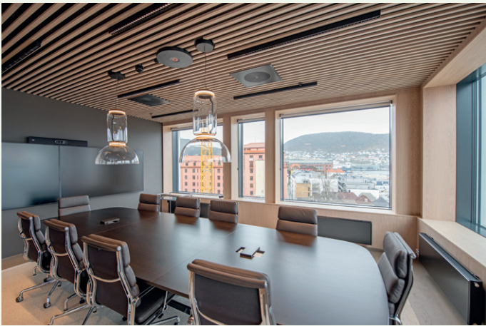
Styreverom, Wikborg Rein.

mentfasade som oppfyller energikrav i Tek17.