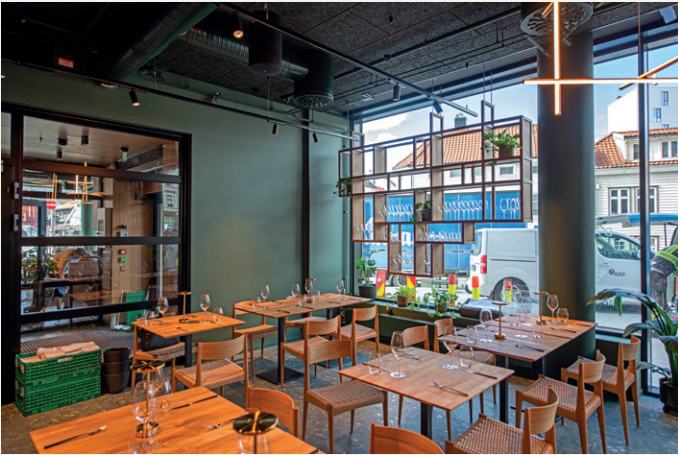
Restauranten Bark Mat og Vinbar ligger i første etasje.

miniumsbelagte glassfasader i første etasje mot Baneveien og Komediebakken.