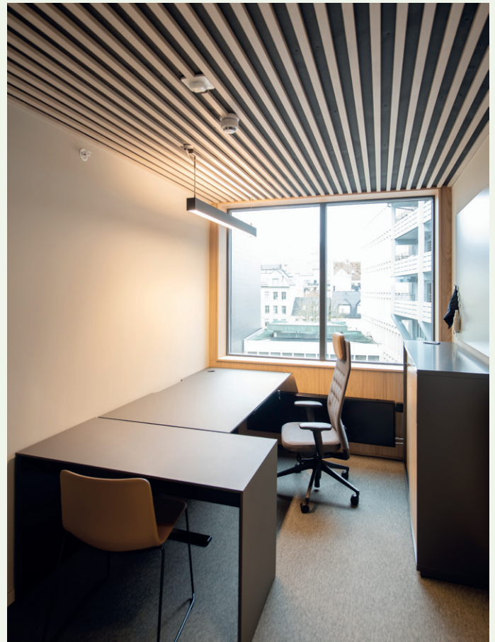
Cellekontor, Wikborg Rein.

– Den nye påhengte fasaden er ikke en eksakt kopi av den originale, men den har et tilsvarende tverrsnitt og dybde som det originale fasaderelieffet. Dette gir en tydelig referanse til bygningens historie og bevarer fasadeuttrykket. For å gjenspeile byggets historie og samtidig gi det et moderne