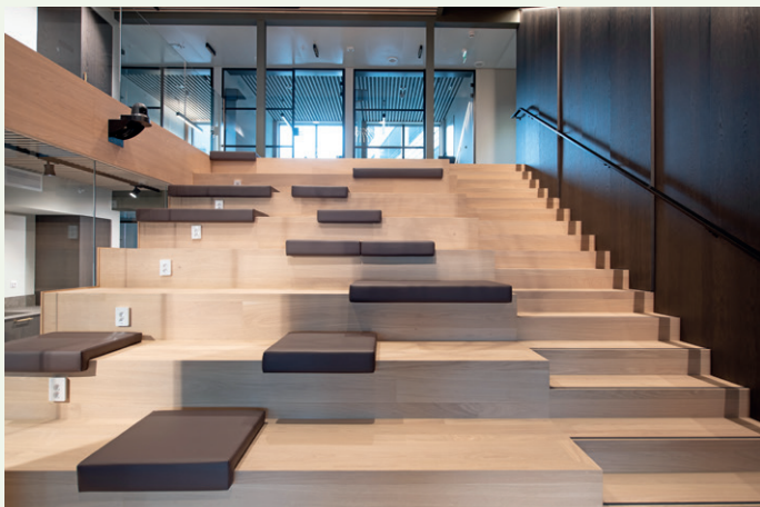
Amfi, Wikborg Rein.