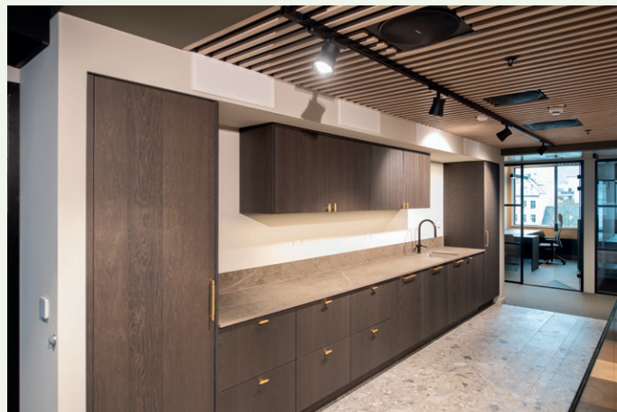
Det er tekjøkken i hver etasje hos Wikborg Rein.

preg, har vi valgt en kombinasjon av glass og steinplater i kledningen. Dette skaper et elegant og eksklusivt uttrykk som harmonerer med omgivelsene, sier Moorhouse.