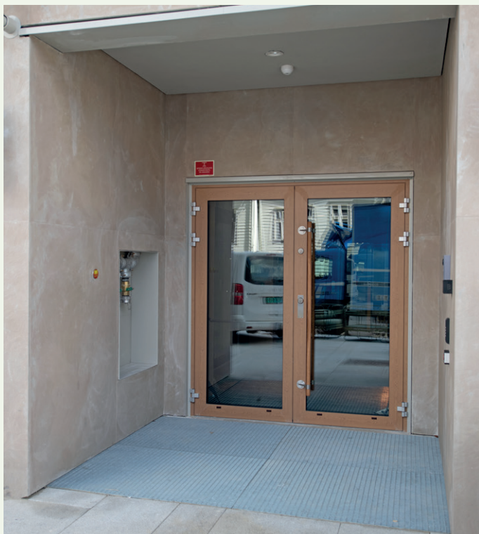
Hovedinngang fra Baneveien.