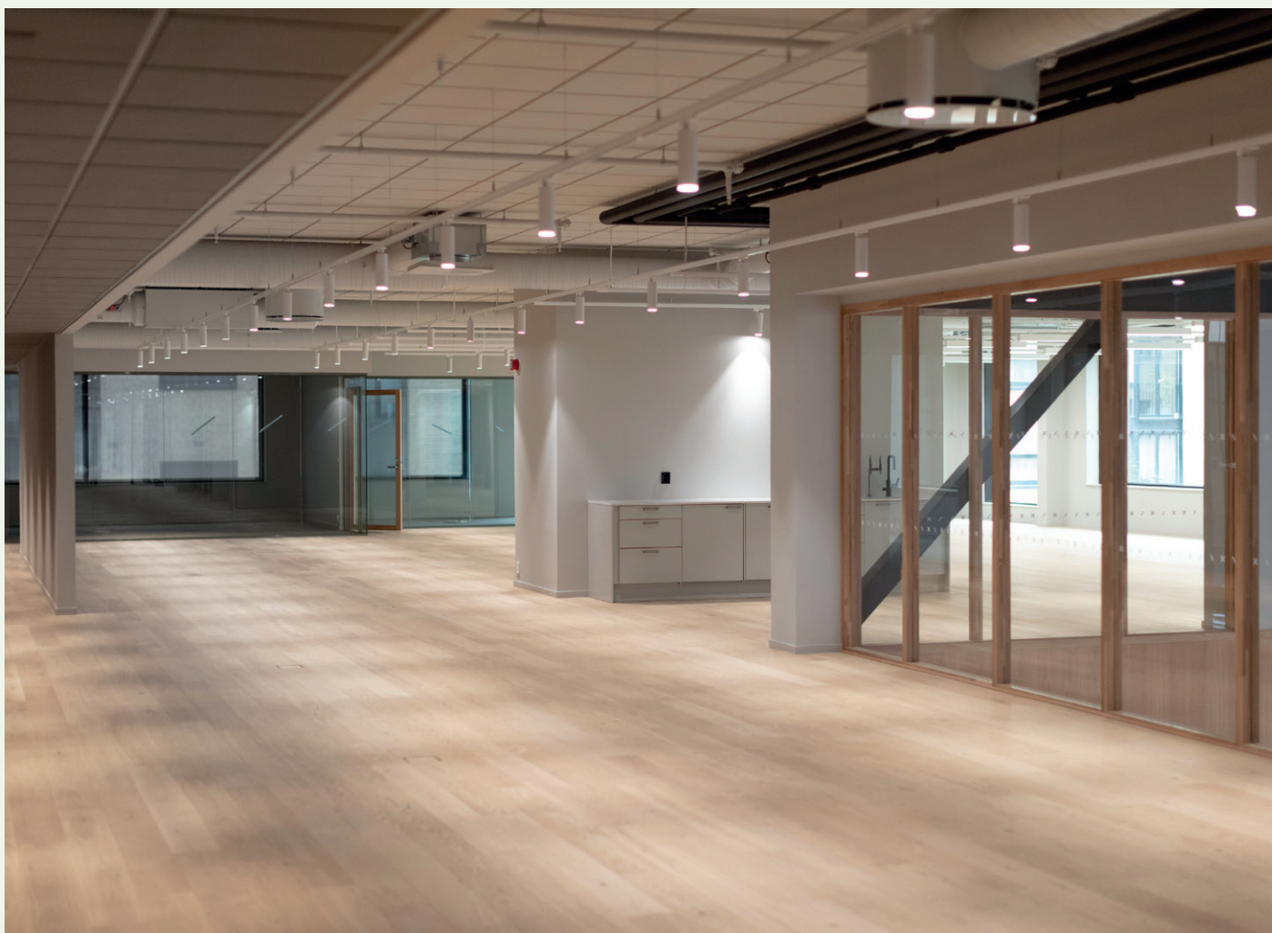
Inne er det også lyse lokaliteter.