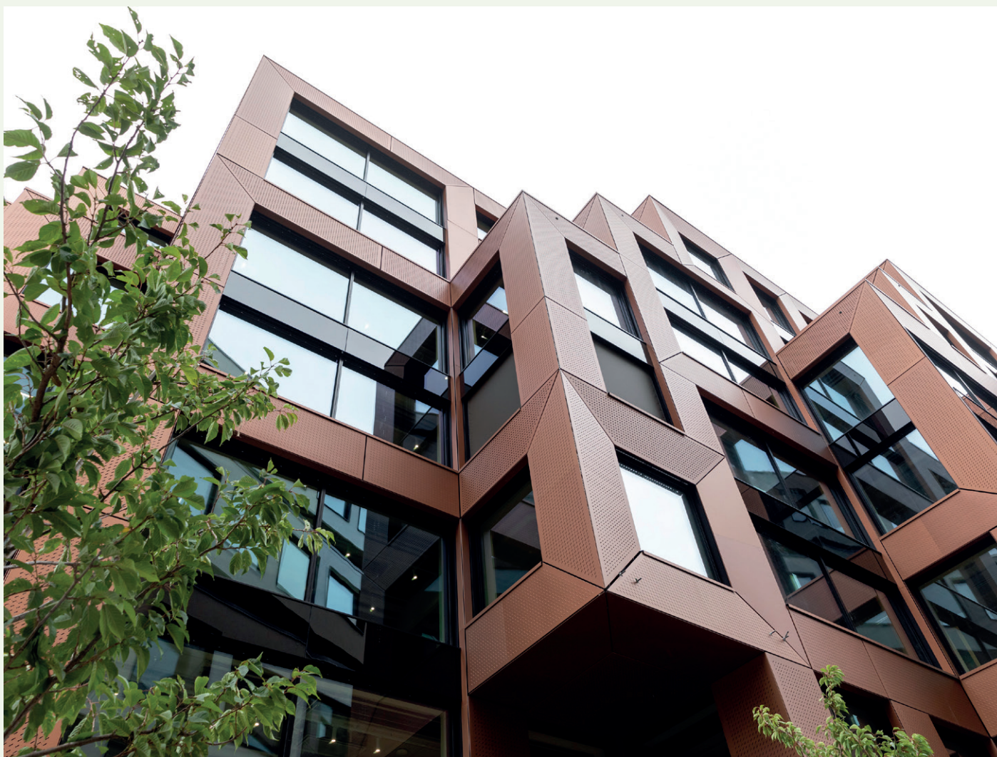
Den utvendige fargen gjenspeiler seg også inne i bygget.