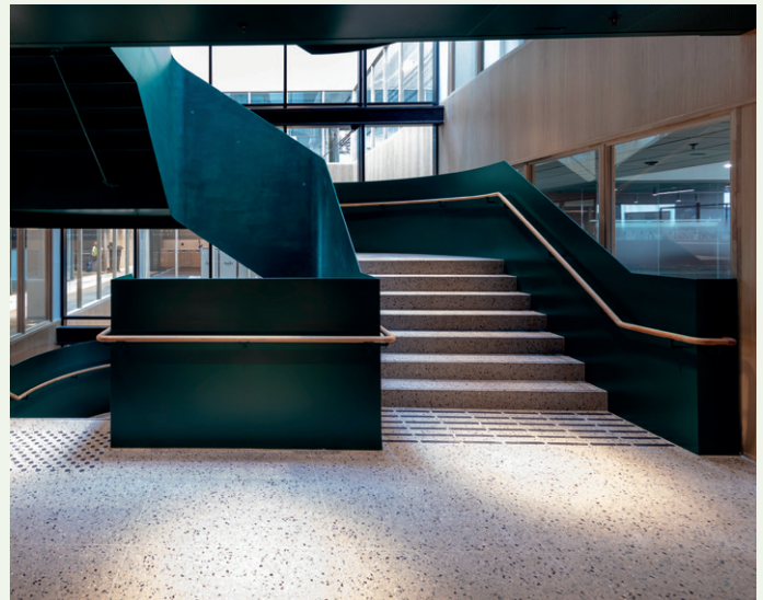
Design både i utforming og fargevalg.

– Bæresystemet kom opp sommeren 2023 ved hjelp av vårt søsterselskap Norske Bæresystemer. Det har vært en stram plan for å ferdigstille, men vi har kommet i mål til avtalt tid med overlevering av utleide arealer den 2. september i år, sier Simonsen.