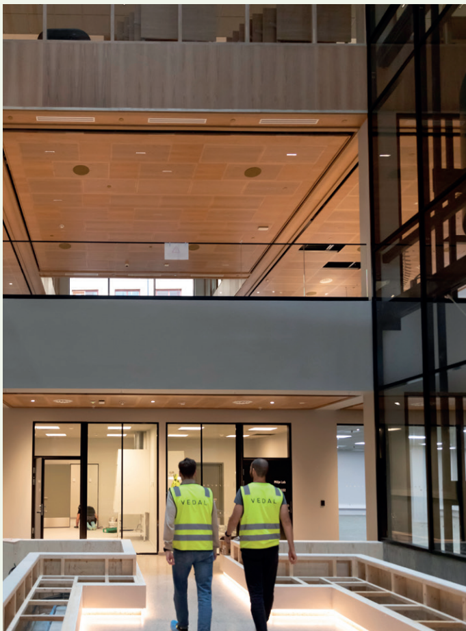
Vedal Entreprenør har utført jobben i samspill med byggherren Eiendomspar.