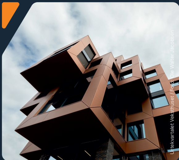
Urtekvartalet Veksthuset

For oss handler det ikke bare om ingeniørkunst. Det handler om å forme morgendagens samfunn.