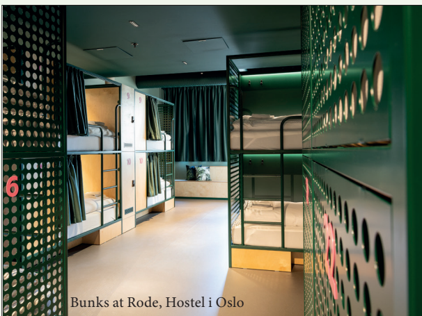
Bunks at Rode, Hostel i Oslo

Vedal Entreprenør har i en samspillskontrakt med byggherren Eiendomsspar satt opp næringsbygget Veksthuset på Grønland i Oslo.