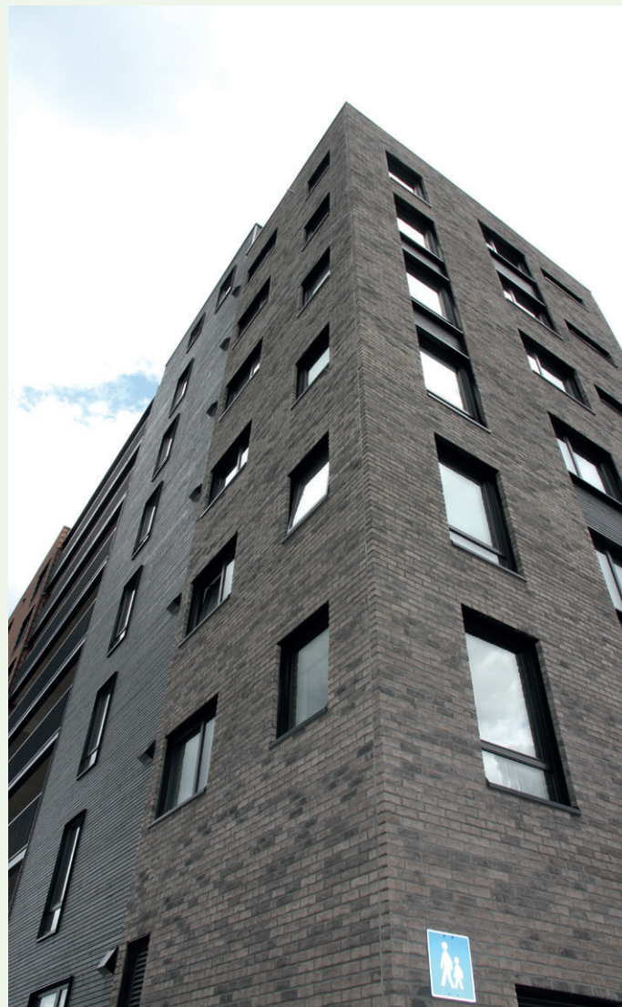
Ulike fasader på blokkene.