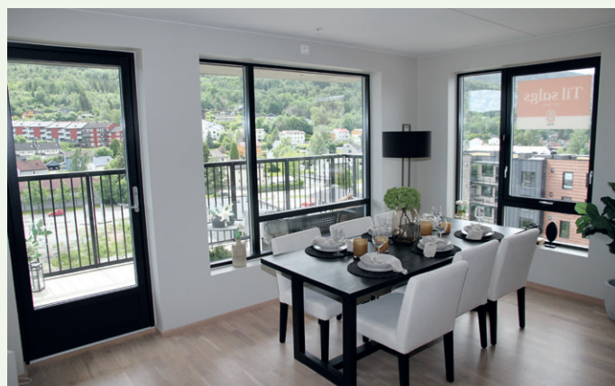
Utsikt over deler av området på Gulsbogen.