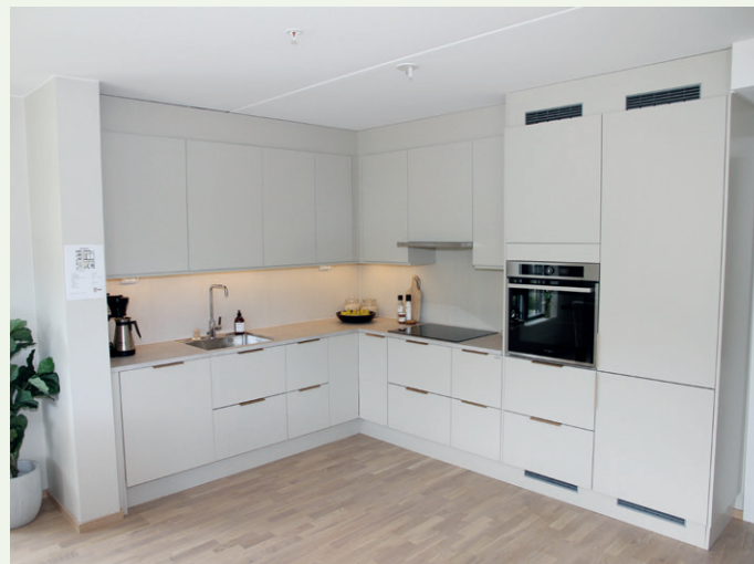
Funksjonelt kjøkken med åpen løsning til stue.

vinduene på fasaden. De øvrige etasjene kles i forskjellige materialer som tegl, bekledningstegl og platekledning. Materialene tegl, bekledningstegl og platekledning er materialer med gode aldringsegenskaper og trenger lite vedlikehold. Trekledning er valgt på steder på fasaden hvor det er lettere å vedlikeholde, ifølge arkitekten.