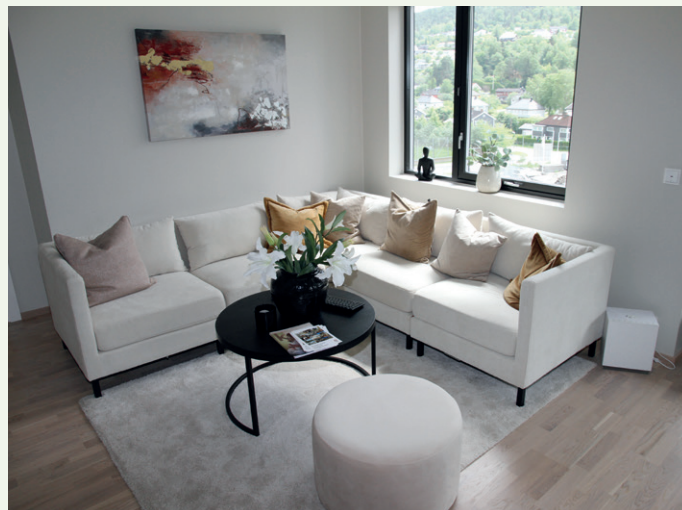
Stue i en av de større leilighetene.

I en epost til Byggeindustrien, skriver arkitekt Regine Nordheim