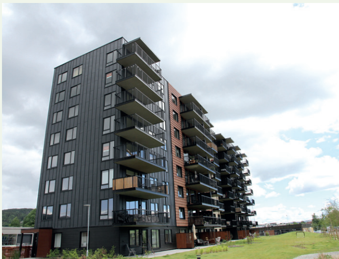
Det nye boligprosjektet dominerer nå den gamle industritomta.