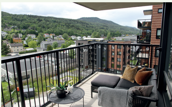
Hyggelig uteplass på balkongen.

JM Norge har satt opp første byggetrinn av boligprosjektet Skulpturen på Gulsbogen i Drammen.