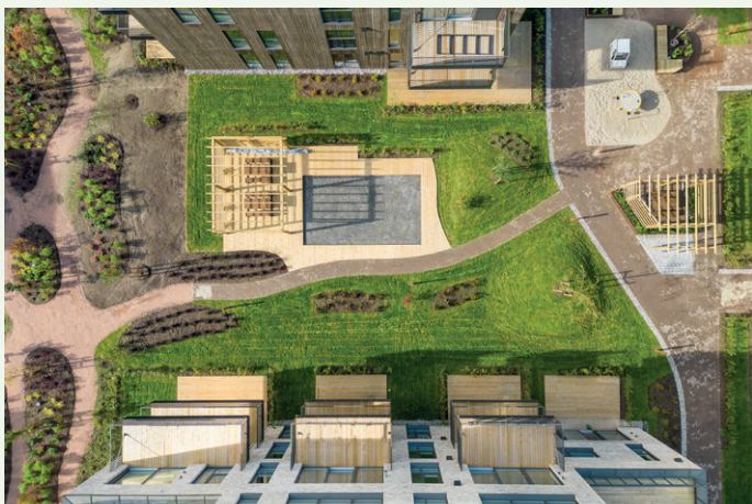
I utbyggingen inngår store grøntarealer, og det er lagt ned omfattende ressurser i parkområder rundt og mellom blokkene.

Underentreprenører og leverandører: Flis: Stryken og Gudbrandsen | Rørlegger og ventilasjon: Assemblin | Elektro: Irby Elektro | Lås og beslag: Låssenteret | Parkett: Parkettgruppen | Gartner: Håkonsen & Sukke | Gulvbelegg: Industriblegg | Maler: Bohlin Prosjekt | Heis: Kone | Blikkenslager: Din Blikkenslager | Rekkverk: Sagstuen | Innvendig trapp: Espa Snekkerverksted | Kjøkken, bad og garderobe: Studio Sigdal | Grunnarbeider: Kongsberg Entreprenør | Takteking: Euro Blikk og Tak | Råbygg: Loe Betongelementer | Vinduer: Lian Vinduer | Dører: Swedoor | Glassfasade: Fasadeconsult