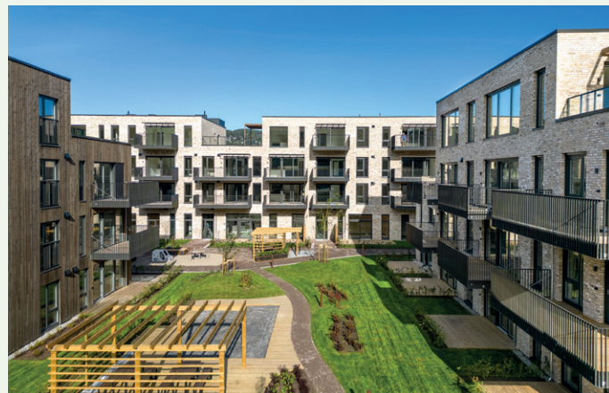
Det er Consto Øst som har bygget ut trinn 2 i en totalentreprise.