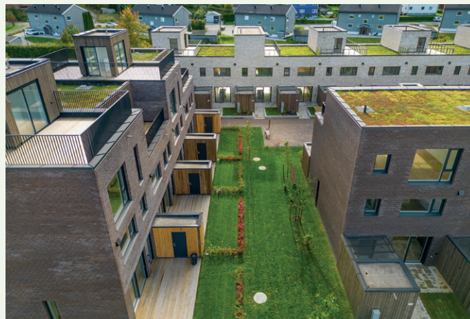
Rundt 50 prosent av takene er beplantet med sedum.

Prosjektet er gjennomført som en samspillsentreprise med incentiv, og kontraktens størrelse er på cirka 315 millioner kro-