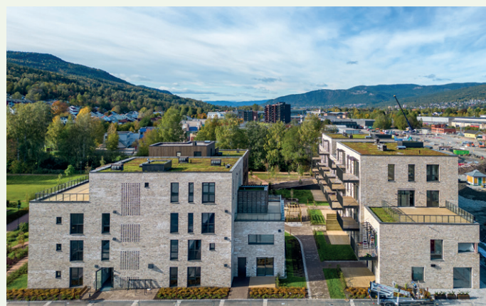
Byggene er i hovedsak teglsteinforblendet. Et av leilighetsbyggene har trefasade.