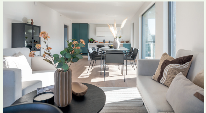
Det har vært muligheter for tilvalg underveis.