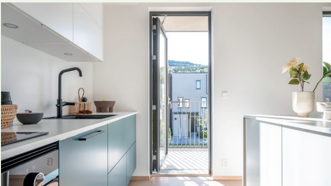
Fra kjøkkenløsningen i en av leilighetene.