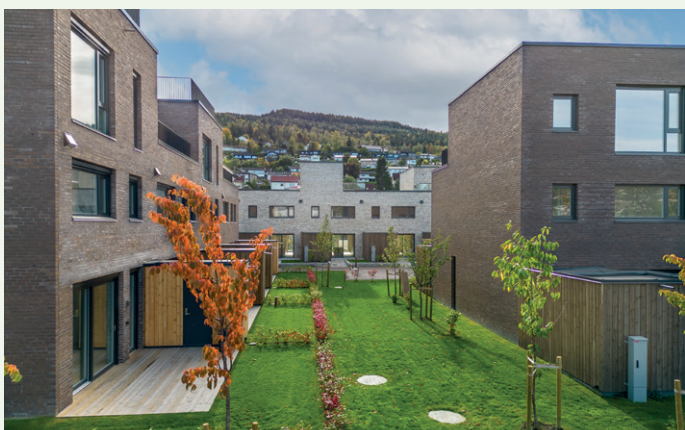
Leilighetene er bygget ut i tre blokker på fire etasjer.