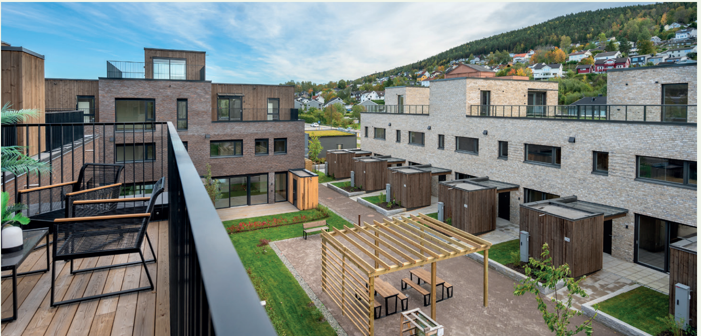
Leilighetene varierer fra 40 kvadratmeter i størrelse til den største enheten som er på hele 160 kvadratmeter. Rekkehusene varierer i størrelse fra 110-180 kvadratmeter.