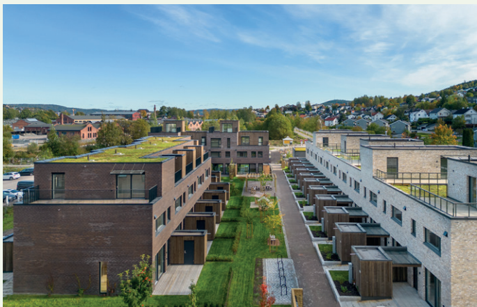
Trinn to består totalt av 65 boenheter fordelt på 43 leiligheter og 22 rekkehus.