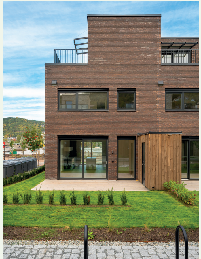
Alle solgte enheter var innflyttet i god tid før jul.