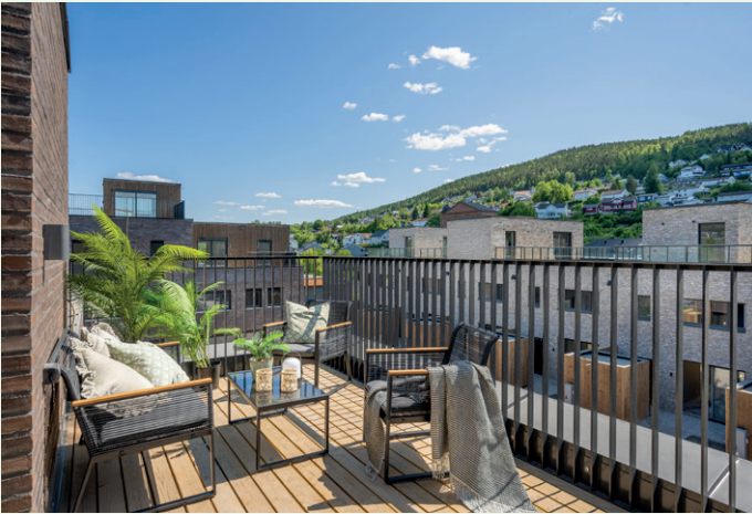
Alle boenhetene har enten balkong, takterrasse eller markterrasse.

– Det har vært muligheter for tilvalg underveis, noe flere også har benyttet, men ikke veldig mange, påpeker Herlofsen.