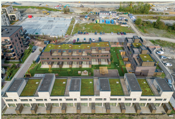
På det gamle industriområdet på Sundland i Drammen er Bane Nor Eiendom i full gang med å transformere området til boliger.

ge kjøretøy som skal ha tilgang til området mellom boenhetene, legger Bøhn til.