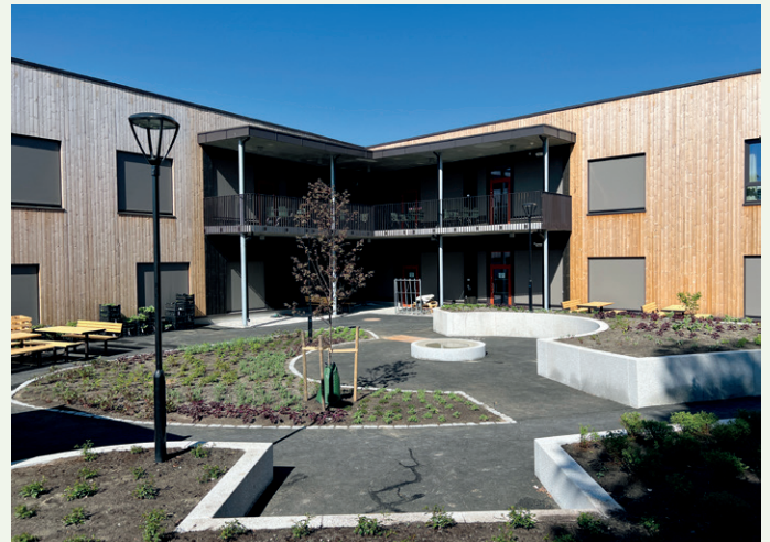
Beboere, ansatte og besøkende skal trives også ute.