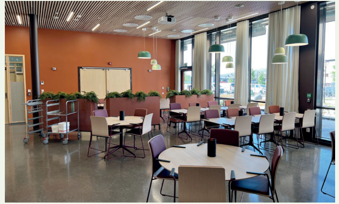
Sykehjemmets kantine ligger rett ved hovedinngangen.