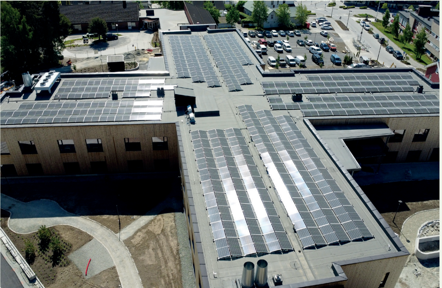
Solcelleanlegget på taket av sykehjemmet består av 520 solcellepaneler.

Systemvegger, spilevegger, spilehimlinger og system- himlinger er utført av: