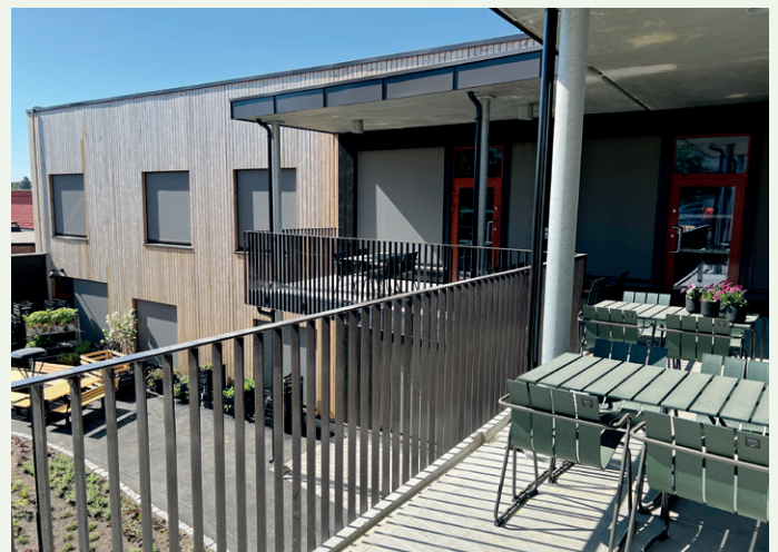
Beboerne har også fellesterrasse.

Ifølge Ringsaker kommune bidrar utformingen av bygget til både effektiv tjenesteutøvelse, rasjonell drift og god logistikk. Det nye sykehjemmet er også påkoblet et naboliggende bo- og omsorgssenter. Det er Oslo-baserte Bølgeblikk Arkitekter som er arkitekten bak prosjektet.