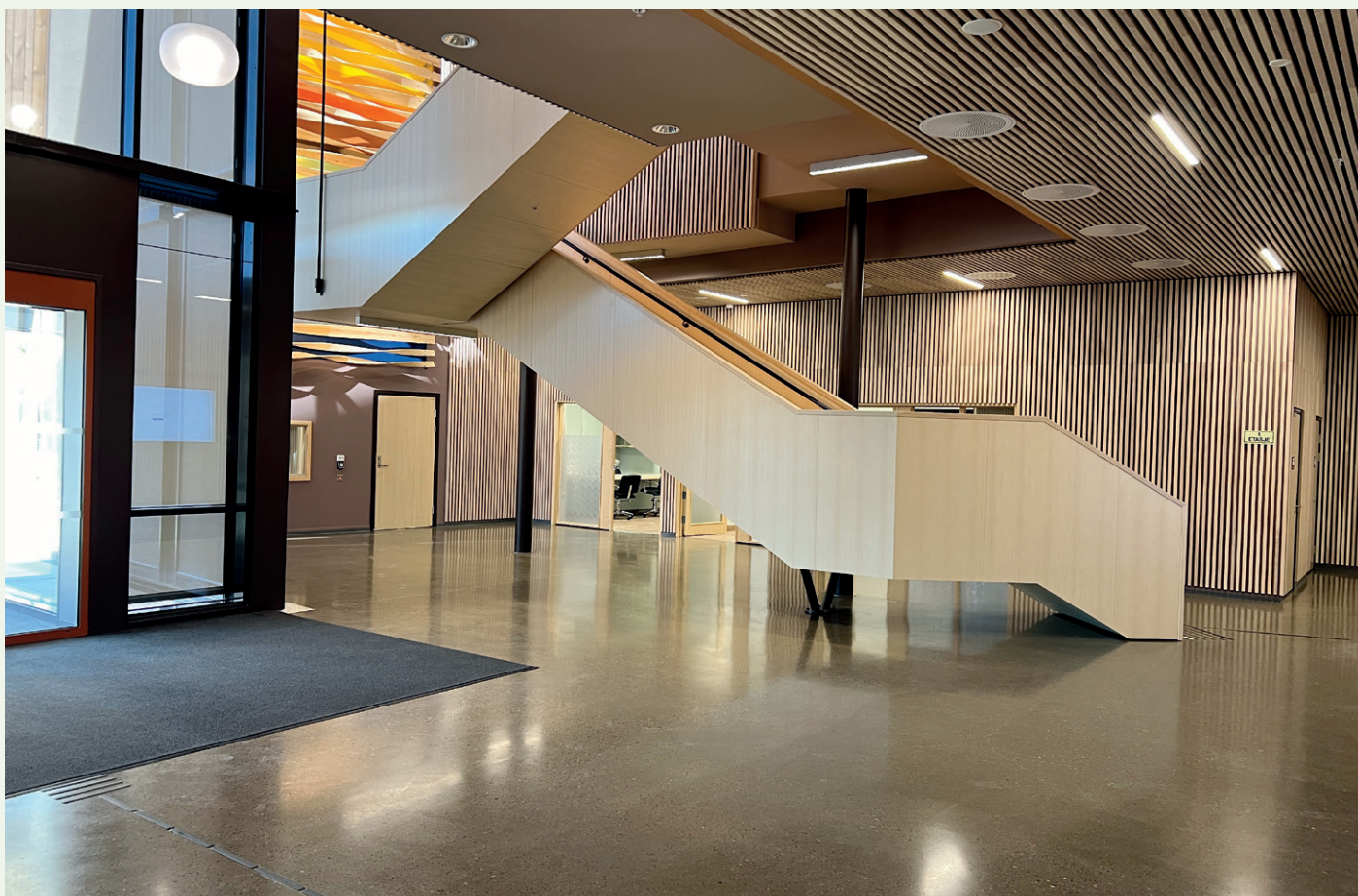
Dette er det første som møter deg når du går inn hovedinngangen til sykehjemmet.