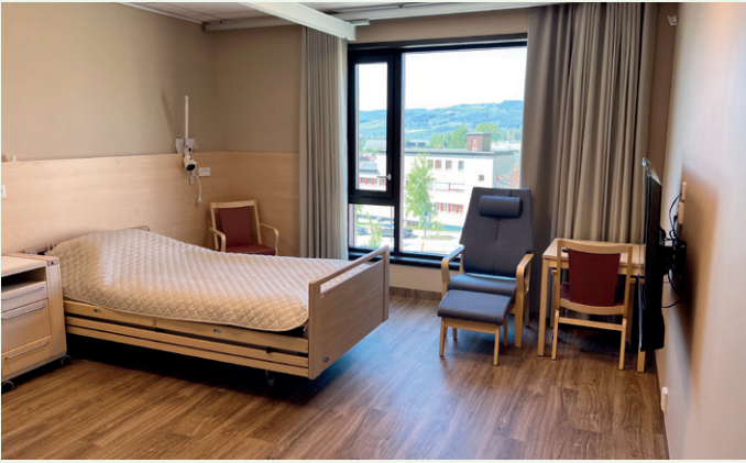
Sykehjemmet har 60 plasser med det kommunen beskriver som hjemmelig preg.