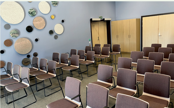
Sykehjemmet har et religionsnøytralt seremonirom.