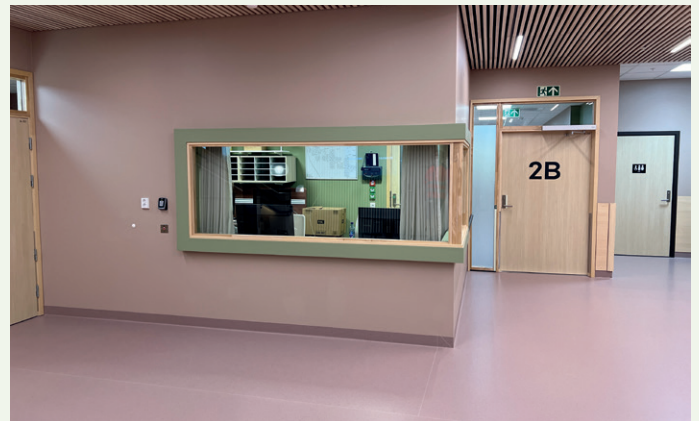
Ifølge entreprenør har prosjektet lagt vekt på å velge løsninger, farger og materialer som skaper en hjemmekoselig atmosfære.

til ytterligere videreutvikling og detaljprosjektering. Samarbeidet mellom involverte parter i prosjektet har fungert veldig bra, og dialogen med byggherre og bruker har vært konstruktiv og god hele veien. Det har gjort at vi har lykkes, sier Kopstad.