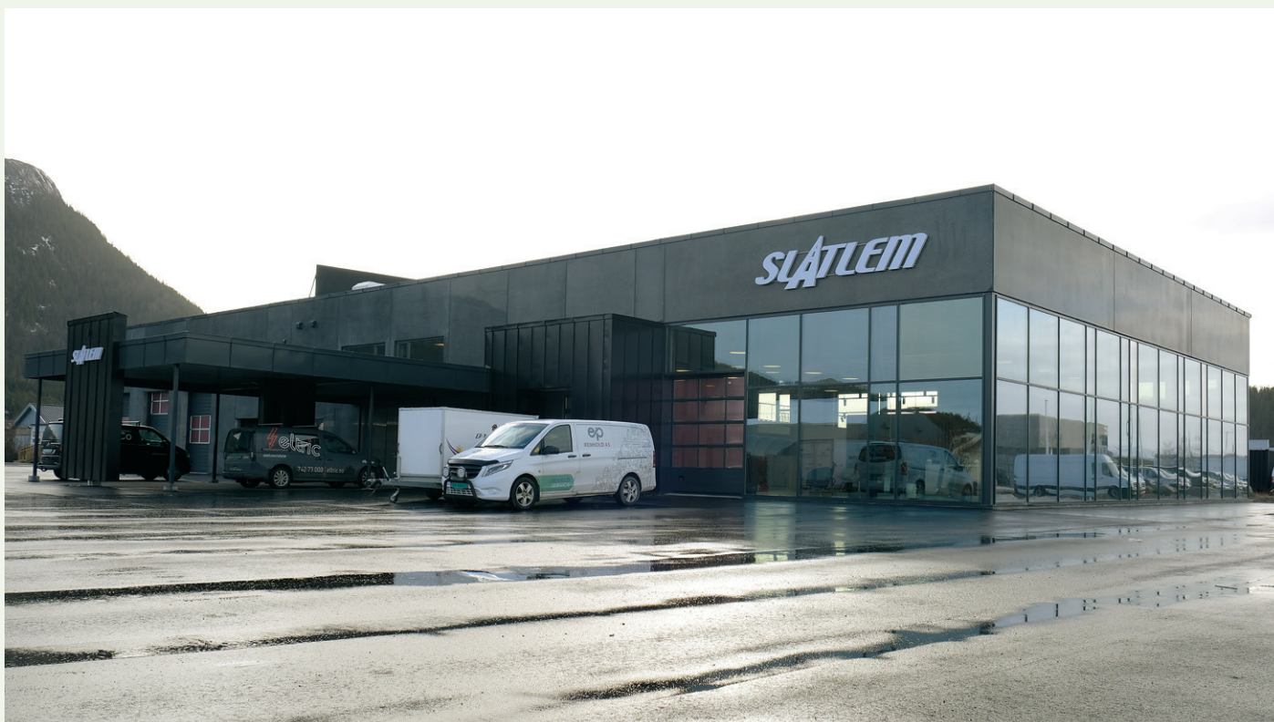
Fasaden med bilhallen innenfor vinduene.

mens resten av etasjen er viet til verksted, vaskehall, delelager og tekniske rom. Deler av bygget er i to etasjer og andre etasje rommer møterom, administrasjon og pauserom/lunsjrom for de 15 ansatte.