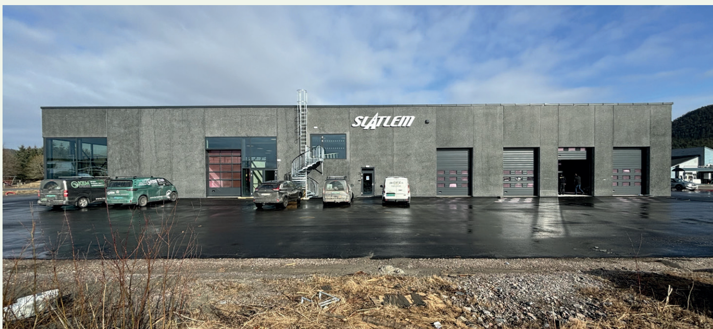
Baksiden av anlegget.

Bilforhandleren Slatlem Namsos ønsker å vokse. Nå flytter de inn i et nytt, større og skreddersydd bygg på Spillum.