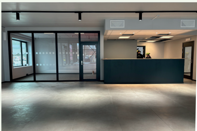
Resepsjonen for kundemottaket.