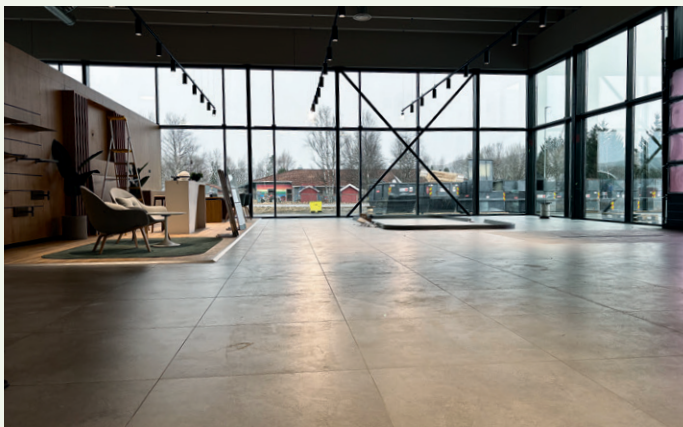
Her kommer bilene.