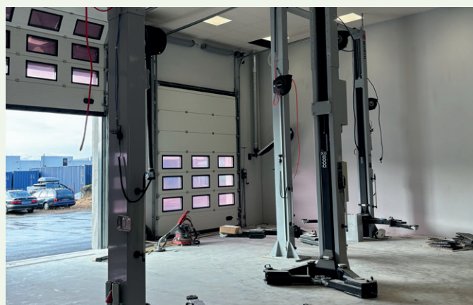
Verkstedet er klart til å ta imot kunder.