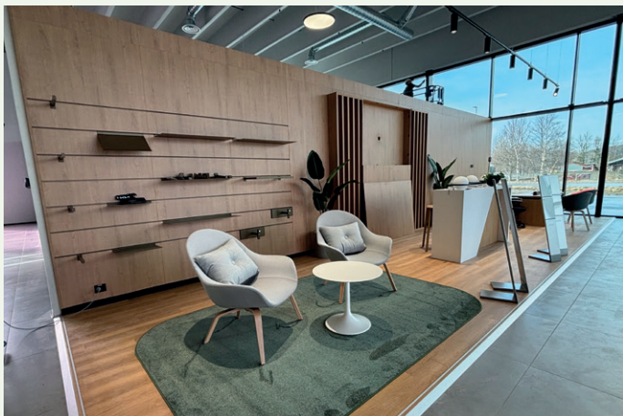
Dette blir KIAs område.