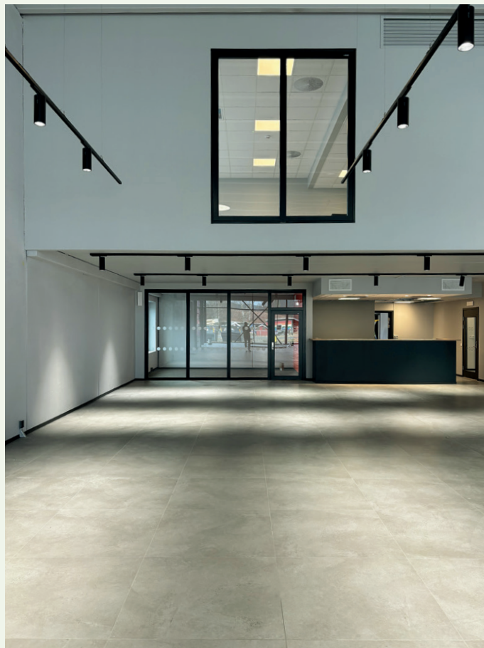
Bilhallen med pauserommet til de ansatte bak det store vinduet i andre etasje.