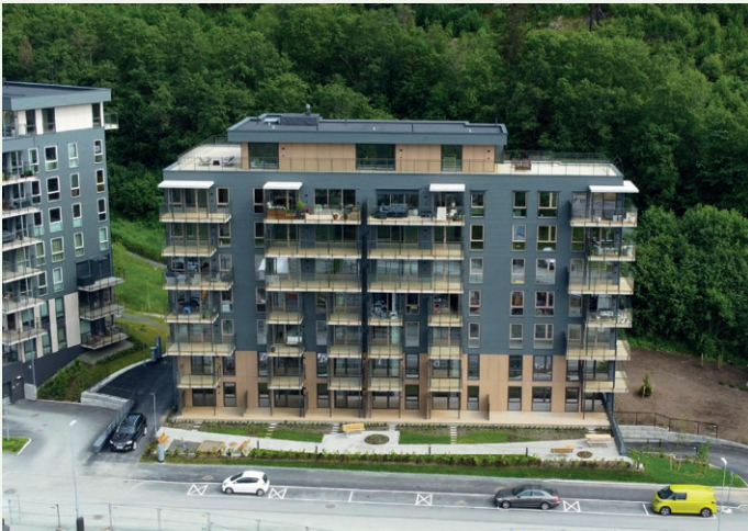
Leilighetene har store glassflater mot vest.