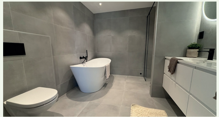
Fra det største badet i penthouse-leiligheten.