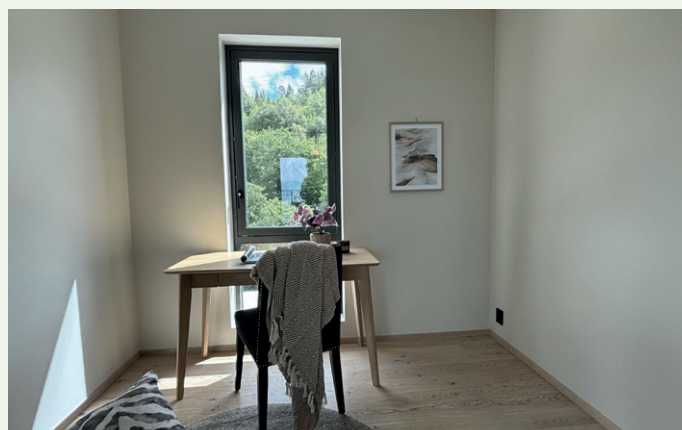
En del rom sikter mot bruk som hjemmekontor.