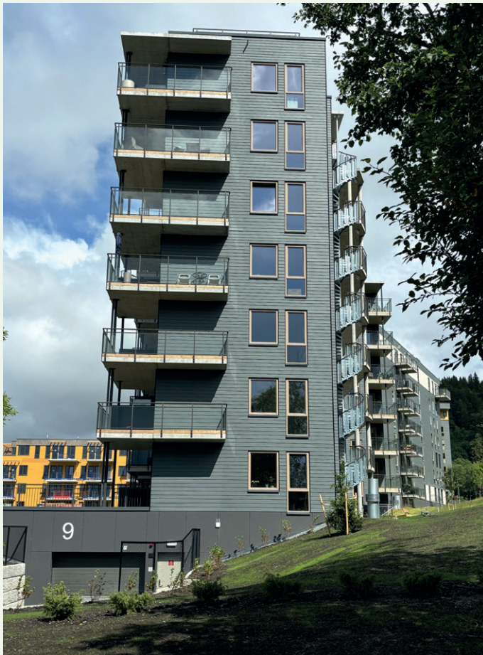
Balkongene til endeleilighetene mot sør er trukket rundt hjørnet.