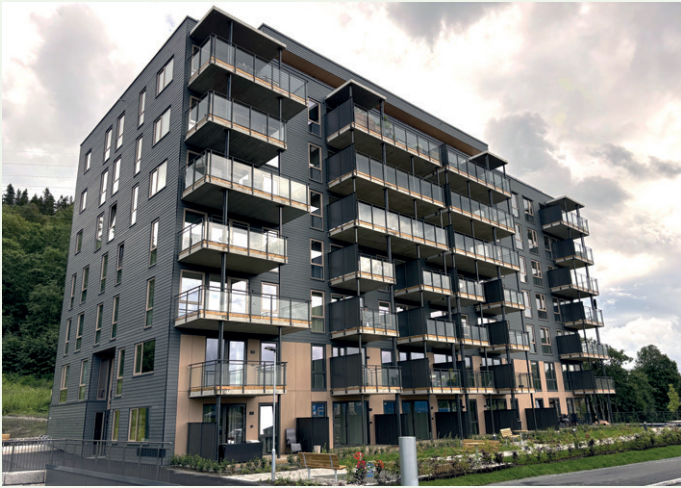
Store vinduer og glass rekkverk på balkongene preger bygget.