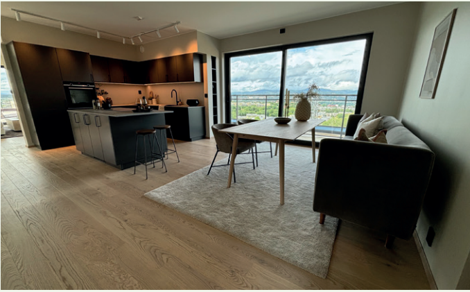
Leilighetene har størrelser fra 38 til 139 kvadratmeter.