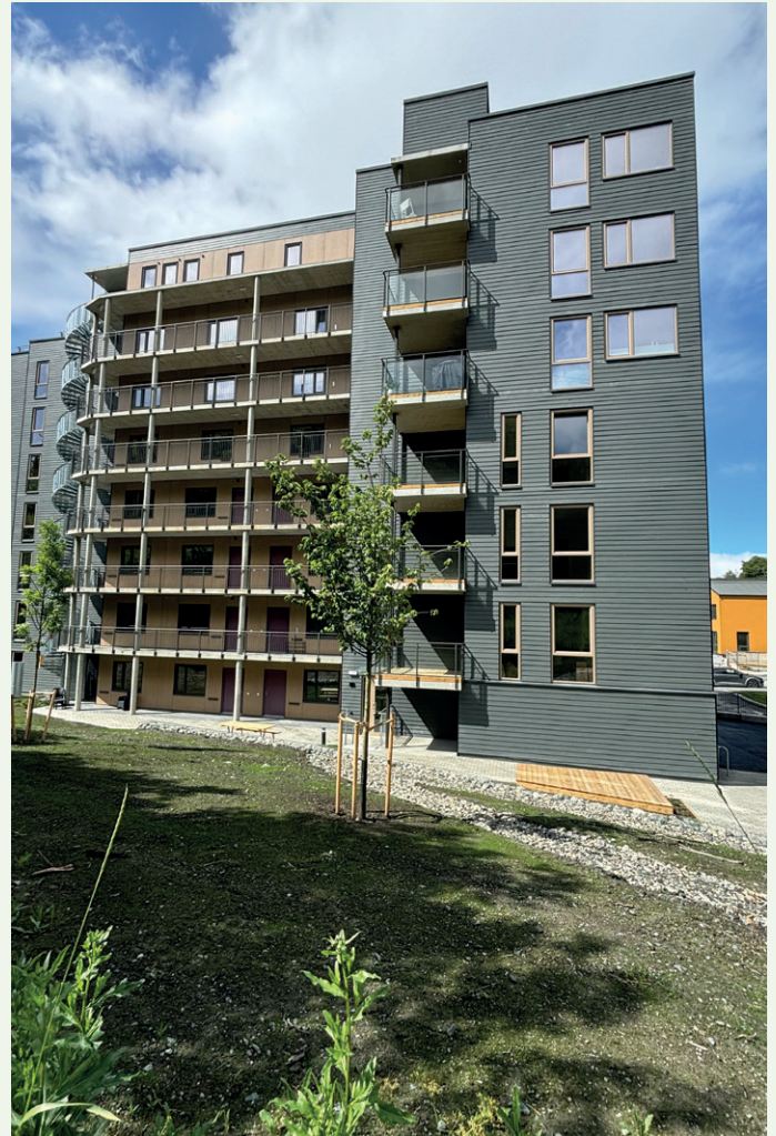
På baksiden er det plantet trær og lagt an for ei blomstereng som knytter bebyggelsen til marka.

ganger i betong som leder til alle leilighetene. Unntaket er topp-leiligheten som har inngang ved heisen.