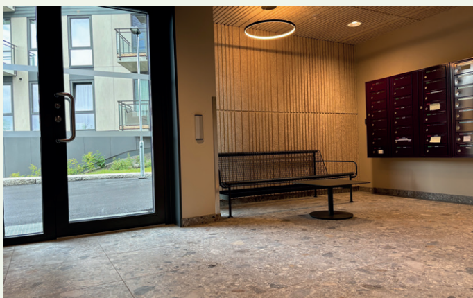
Lobbyen har Mirage flisgulv og postkasser i signaturfargen aubergine.