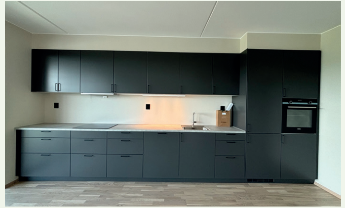
Alle kjøkken er fra Drømmekjøkkenet.

Arbeidet er godt i gang med å lage et nytt bekkedrag og ei ny turløype som skal ligge i ytterkanten av utbyggingsområdet.