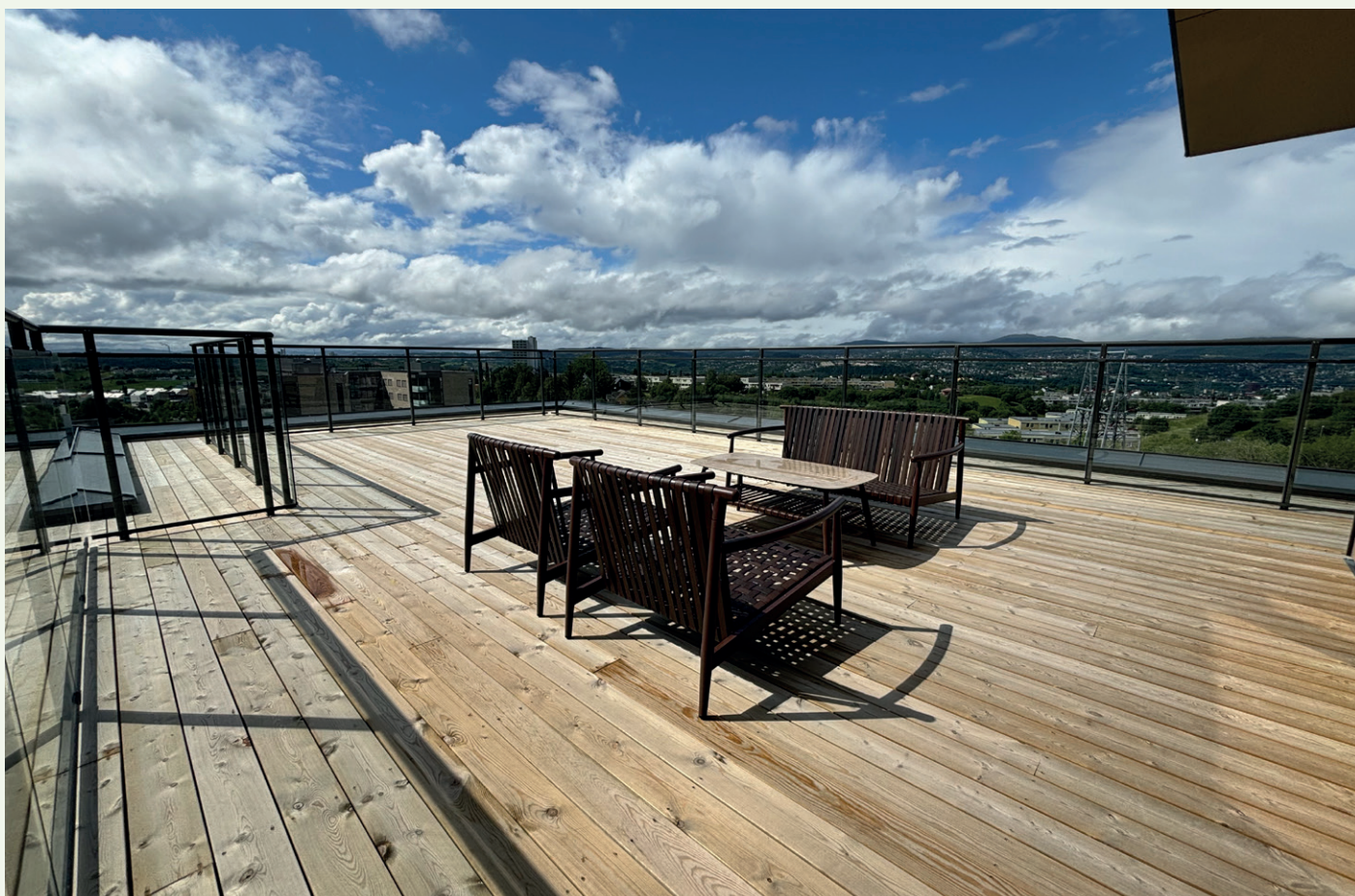
Upåklagelig utsikt fra takterrassen som går hele veien rundt toppleiligheten.